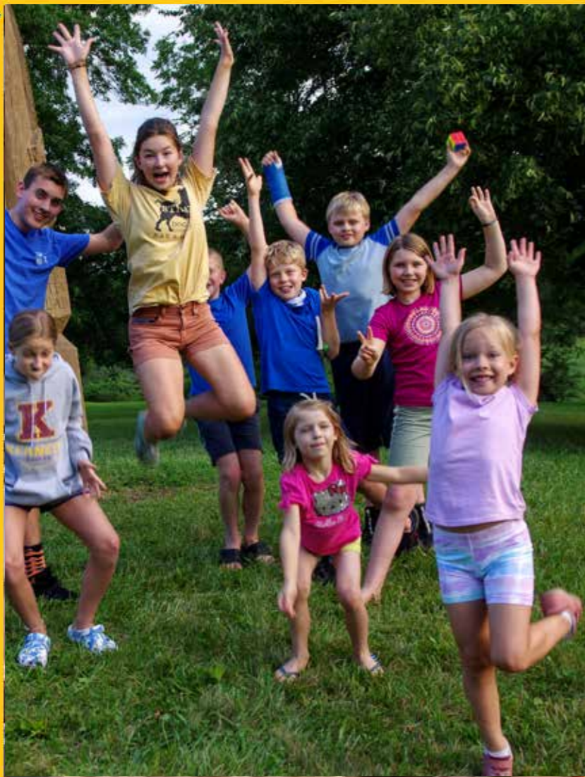
Šiaurės Amerikos Ateitininkų Taryba